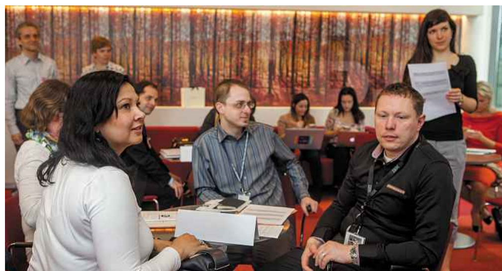
Diverzita je koncept, který podporuje všechny skupiny bez rozdílu