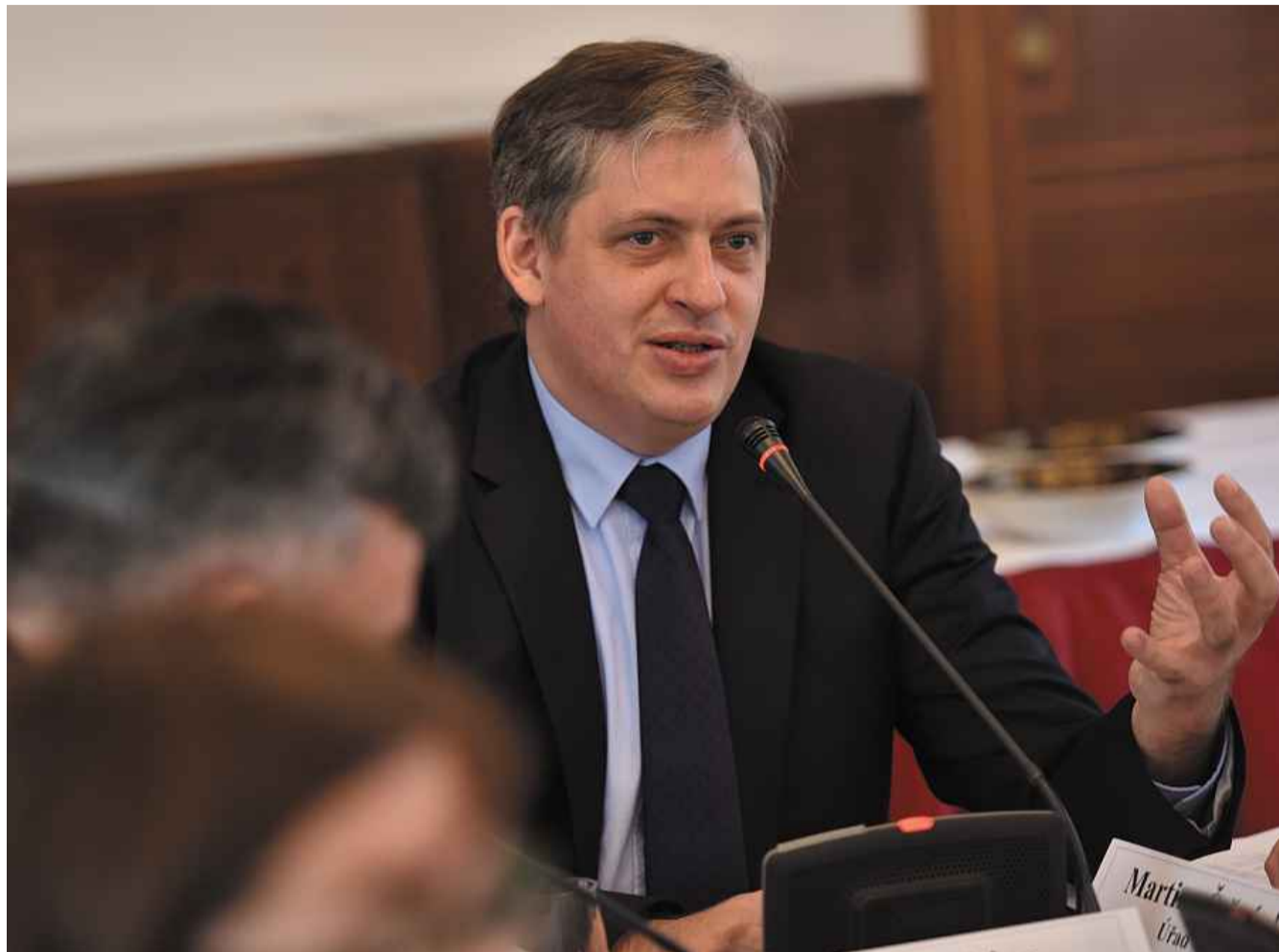
Ministr Jiří Dienstbier chce do vedení firem prosadit více žen

Můj úřad také připravil akční plán pro vyrovnané zastoupení žen a mužů v rozhodovacích pozicích na léta 2016 až 2018, který byl v minulých týdnech projednáván v meziresortním připomínkovém řízení. V současnosti obdržené připomínky vypořádáváme a materiál bych měl vládě ČR předložit koncem dubna. Tento akční plán přinese řadu konkrétních opatření ať už v oblasti politiky, veřejné správy, ale i obchod-